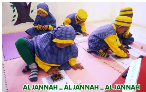
Gambar 3. Potongan Frame Video

Hasil video profil memiliki durasi dua menit tiga puluh delapan detik untuk versi panjang dan versi pendek sepanjang 1 menit untuk kepentingan instagram (sebagai batas waktu adaptasi publikasi di kanal story ). Potongan frame dari video yang dihasilkan dapat dicermati pada gambar 3.