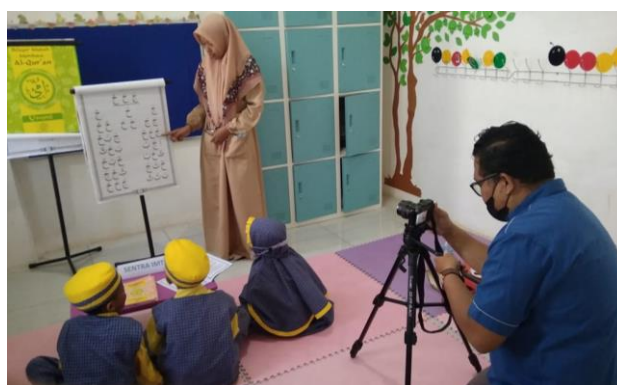
Gambar 2. Proses Shooting

Tahap kedua dilakukan pada bulan Juni 2021 yang melibatkan pihak sekolah untuk melakukan simulasi proses belajar mengajar. Hal tersebut dilakukan karena pada periode tersebut, di saat pandemi proses belajar mengajar sejatinya dilakukan secara daring. Sebagai efek dari tahap pertama yang telah memetakan CA dari sekolah, maka proses shooting dapat dilakukan dengan sangat efisien, yakni satu hari kerja. Sedangkan proses finishing yang didalamnya meliputi proses edit dan rendering dilakukan dalam waktu 1 minggu.