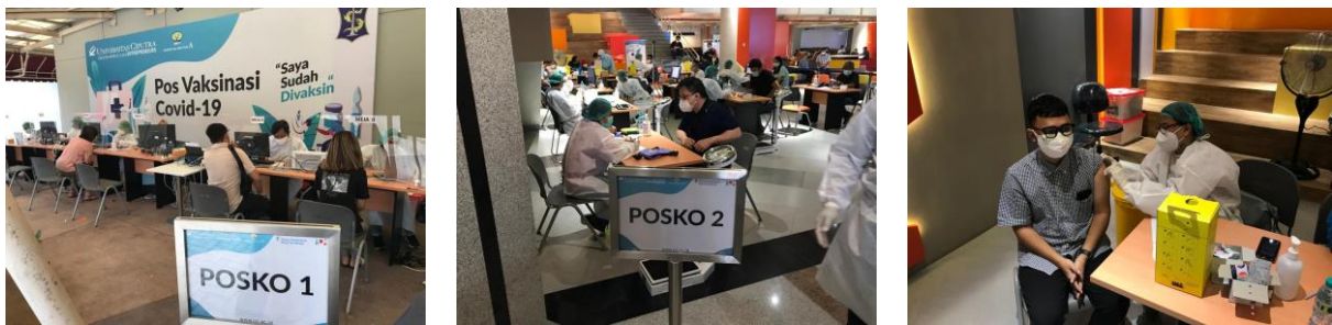
Gambar 5. Pelaksanan Vaksinasi Covid-19

Setelah pelatihan Vaksinator dilakukan koordinasi intens dengan Puskesmas Made sebagai mitra pelaksana Vaksinasi tahap dua. Juga dilakukan koordinasi dengan Universitas Ciputra untuk pelaksanaan Vaksinasi Covid-19 tahap dua. Koordinasi juga dilakukan dengan dinas Kesehatan kota Surabaya. Terdapat pre dan post test pada pelatihan vaksinator dengan luaran berupa sertifikat pelatihan sebagai vaksinator.