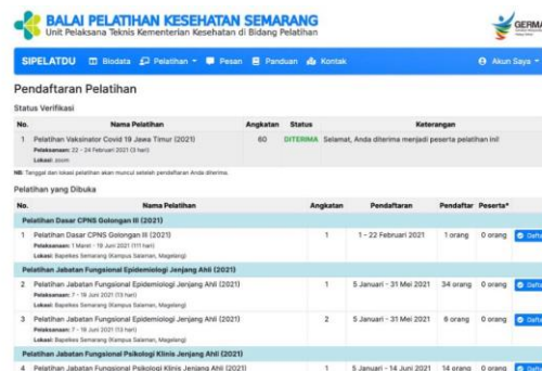
Gambar 3. Pelatihan Vaksinator Covid-19

Kegiatan pelatihan petugas vaksin dilakukan selama tiga hari dari tanggal 22-24 Februari 2021 secara daring sebagai prasyarat menjadi vaksinator. Pelatihan di fasilitasi oleh Pemerintah Pusat berkoordinasi dengan Dinas Kesehatan.