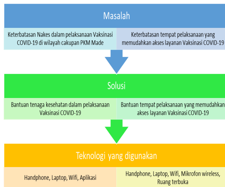
Gambar 2. Visualisasi gambaran IPTEK

Universitas Ciputra dan beberapa institusi pendidikan yang berada di wilayah Barat dan menjadi bagian dari cakupan Puskesmas Made. Kegiatan Vaksinasi tahap dua merupakan program pemerintah dan puskesmas Made membutuhkan dukungan tenaga kesehatan dan tempat layanan yang memudahkan akses pelayanan vaksinasi. Solusi yang ditawarkan adalah kesediaan tenaga kesehatan dan tempat layanan untuk melaksanakan program Vaksinasi Covid-19 tahap 2. Solusi berupa bantuan tenaga kesehatan dan tempat pelaksanaan vaksin yang memudahkan akses pelaksanaan menjadi hal yang penting dalam mensukseskan program Vaksinasi COVID-19.