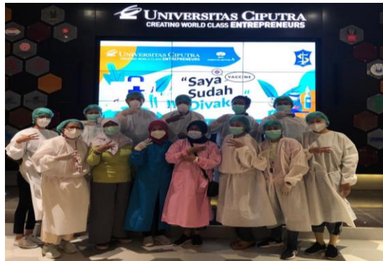
Gambar 6. Dokumentasi Tim Vaksinasi Covid-19

Pada surat keterangan tersebut juga diberikan no. kontak jika ada keluhan pasca vaksin. Briefing bersama mitra tiap pagi dilakukan sebelum memulai kegiatan vaksinasi.