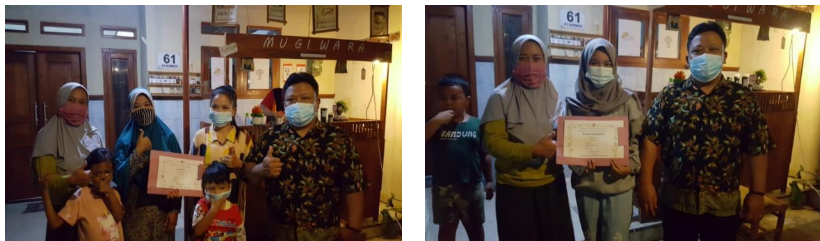
Gambar 2 : Juara lomba Yel Ayo Pakai Masker