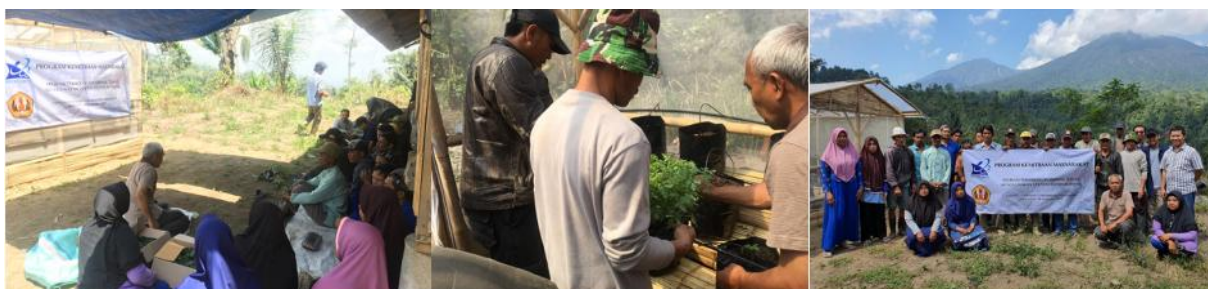
Gambar 1. Pelaksanaan kegiatan penyuluhan di Desa Parentas, Kec. Cigalontang

Teknik budidaya tanaman secara hidroponik merupakan salah satu teknologi budidaya tanaman yang memiliki potensi untuk menghasilkan suatu produk pertanian yang memiliki kualitas yang baik dan bernilai tinggi. Teknik ini dapat diaplikasikan untuk budidaya tanaman sayuran dan salah satunya adalah tanaman tomat dengan metode hidroponik. Tetapi, teknik budidaya ini belum dikenal oleh masyarakat terutama daerah pedesaan seperti Desa Parentas, sehingga kegiatan pengabdian perlu dilakukan di desa ini untuk mengenalkan peranan dan pentingnya budidaya tanaman tomat secara hidroponik. Dari hasil kegiatan ini dapat terlihat bahwa masyarakat Desa Parentas sangat antusias untuk mengikuti kegiatan ini (Gambar 1)