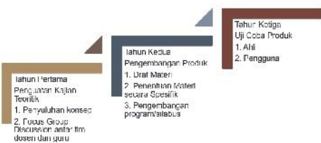
Gambar 3. Materi Pengabdian 3