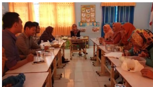
Gambar 6. Perumusan Solusi