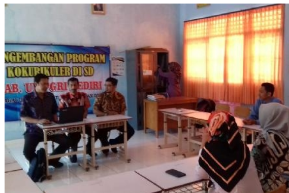
Gambar 8. Tahap Pelaksanaan Penyuluhan 2

Para guru menjadi semakin memahami konsep kokurikuler (sebagai program tambahan intrakurikuler) dan diharapkan setelah kegiatan ini para guru siap dalam program pengabdian selanjutnya, yaitu pengembangan program kokurikuler secara fisik.