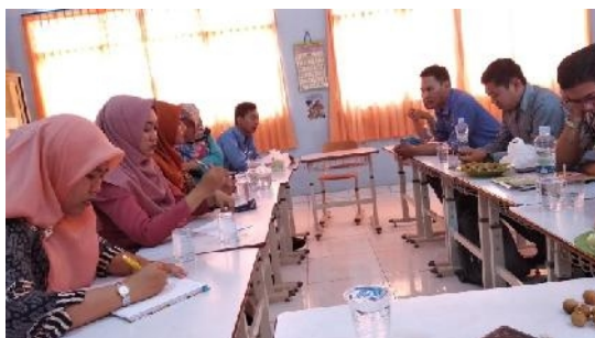
Gambar 5. Tahap Analisi Situasi