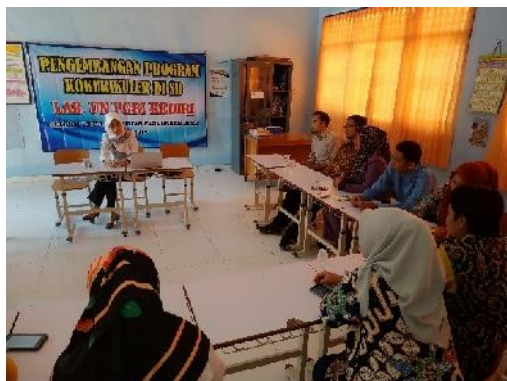
Gambar 7. Tahap Pelaksanaan Penyuluhan 1