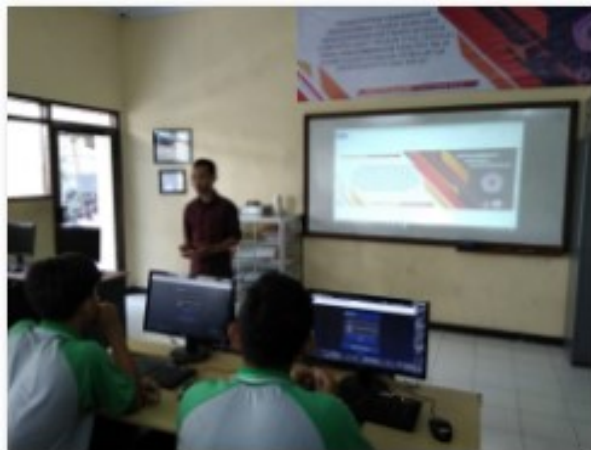
Gambar 3. Penjelasan Awal