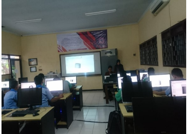
Gambar 6. Memperhatikan Materi