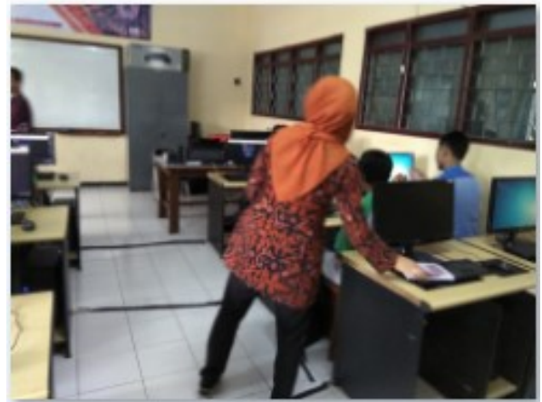
Gambar 2. Pembagian Modul