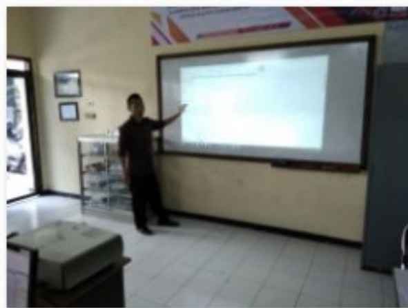
Gambar 5. Pemberian Materi