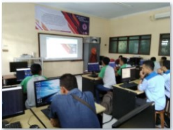
Gambar 4. Peserta Memperhatikan