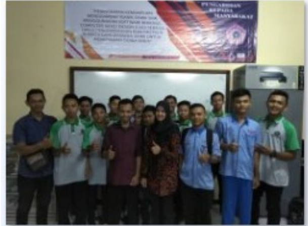
Gambar 8. Foto Bersama