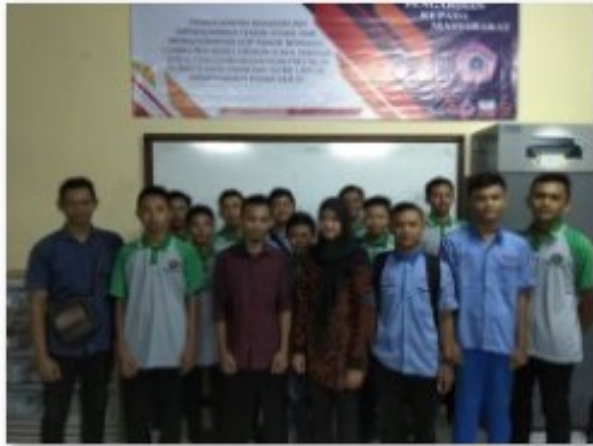
Gambar 7. Foto Penutupan