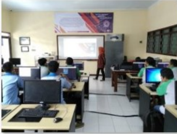
Gambar 1. Pembukaan

Materi diberikan selama beberapa sesi sesuai dengan penjabaran materi yang ada di modul, di mana setiap akhir sesi diakhiri dengan pemberian tugas dan evaluasi untuk mengukur pemahaman materi yang diserap oleh peserta.